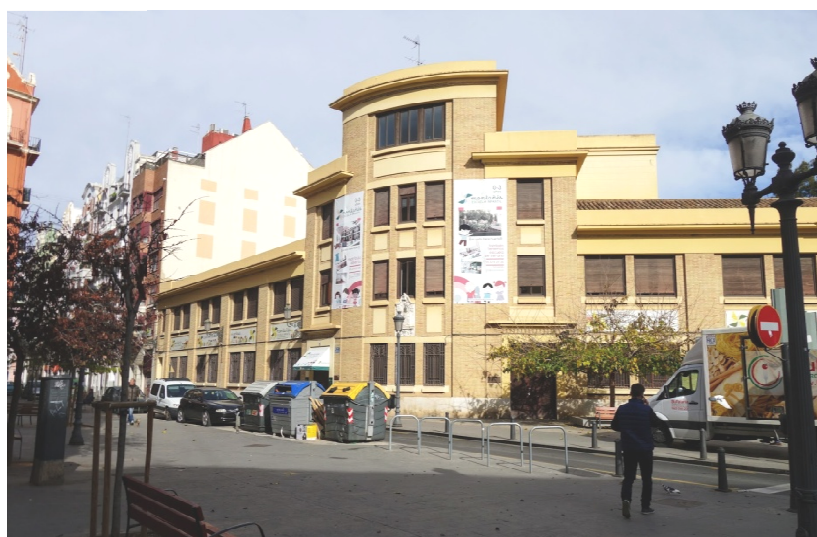
Vista del Centro "Juan de Dios" desde la intersección C/ Pintor Salvador Abril- C/ Pedro III El Grande