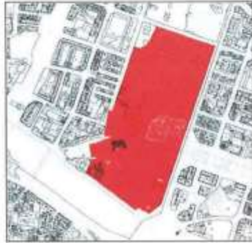
Entorno de protección, identificación de los elementos protegidos