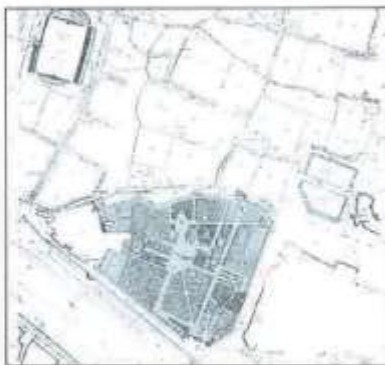
Cartográfico Municipal 1929-1945