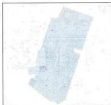
Cartográfico C.G.C.C.T 1980