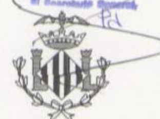
ILUSTRACIÓN: El presente plano fue aprobado por el Excmo. Ayuntamiento Pleno, en sesión de 25 de Abril de 2000 Valencia, 25 JUL 2000 El Excmo. Alcalde