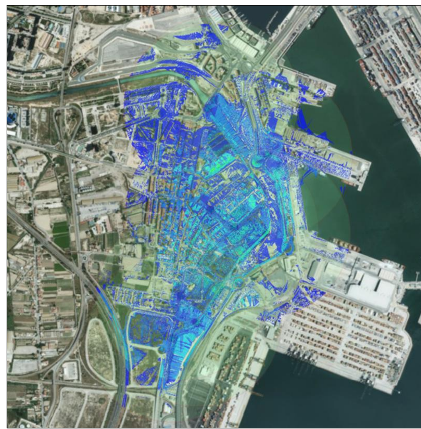
CUENCA VISUAL DEL UMBRAL DE NITIDEZ DE 0 A 500m