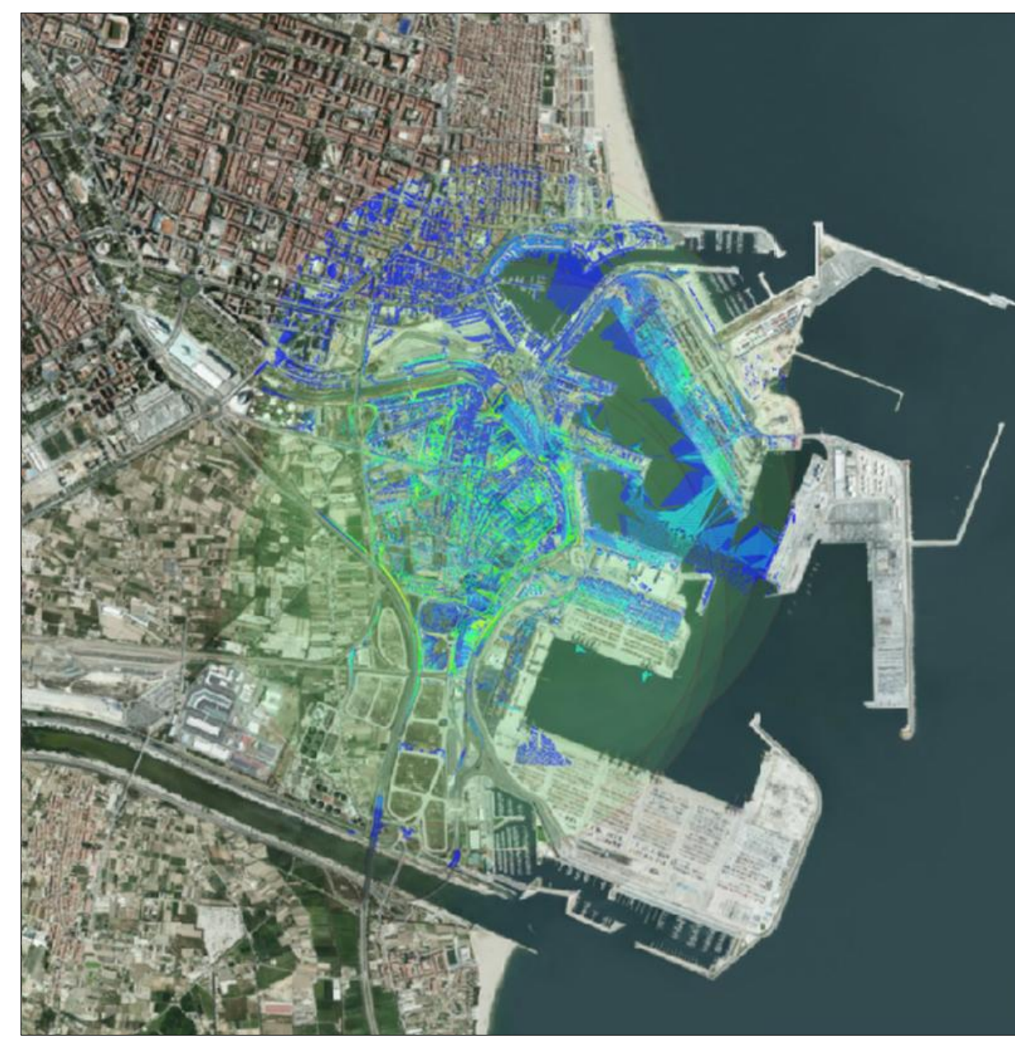
CUENCA VISUAL DEL UMBRAL DE NITIDEZ DE 500m A 1500m