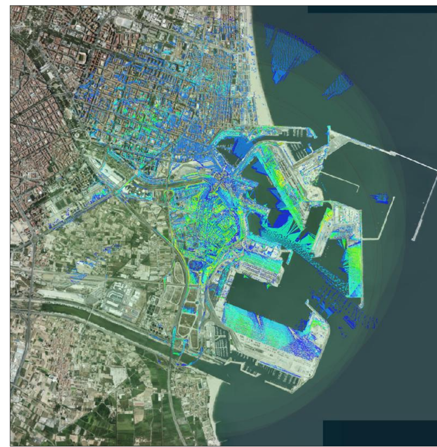
CUENCA VISUAL DEL UMBRAL DE NITIDEZ DE 1500 A 3000m